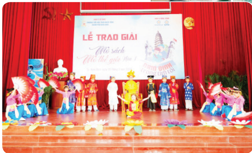
Một tác phẩm văn học đã được "sân khấu hóa" tại Cuộc thi "Mở sách - Mở thế giới" do Trường Tiểu học Trần Nhân Tông (thành phố Nam Định) tổ chức.