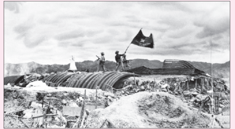
Chiều 7-5-1954, lá cờ "Quyết chiến - Quyết thắng" của Quân đội nhân dân Việt Nam tung bay trên nóc hầm tướng De Castries. Chiến dịch lịch sử Điện Biên Phủ đã toàn thắng.