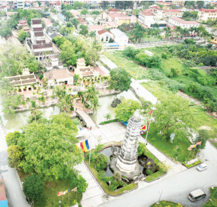
Toàn cảnh Chùa Cổ Lễ.

Trên địa bàn huyện Trực Ninh có 45 di tích lịch sử - văn hóa được xếp hạng, trong đó có 7 di tích cấp quốc gia, tiêu biểu như: Chùa Cổ Lễ (thị trấn Cổ Lễ), Đền - Chùa Cự Trữ, Chùa Cổ Chất (xã Phương Định), địa điểm các đồn binh thời Trần (xã Trung Đông), Chùa Ninh Cường (xã Trực Cường)... Theo thời gian, nhiều di tích trên địa bàn huyện có nguy cơ xuống cấp đã được bảo tồn, tôn tạo đúng nguyên trạng, phát huy giá trị giáo dục lịch sử - văn hóa truyền thống, đáp ứng nhu cầu tâm linh của nhân dân.