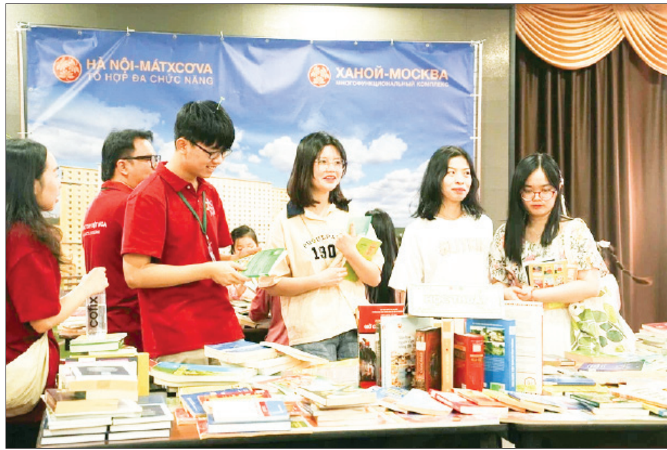
Ban tổ chức đã cập nhật nhiều đầu sách mới tại Hội sách năm nay.