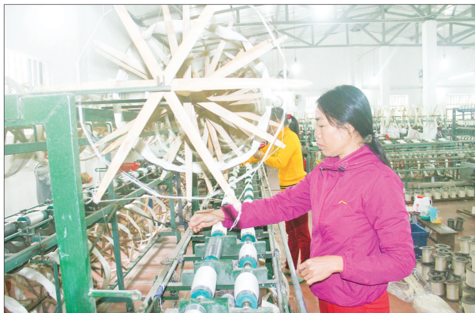
Quay tơ, dệt lụa tại làng nghề Cổ Chất, xã Phương Định (Trực Ninh).

đấu xảo mở ở Kinh thành Thăng Long và đoạt được giải cao do Phủ Thủ hiến Bắc Kỳ trao. Nghề trồng dâu, nuôi tằm và ươm tơ, dệt lụa được coi là "một vốn bốn lời", mang lại nhiều việc làm, thu nhập cho người dân và tạo nên nét văn hóa vùng miền đặc sắc. Lúc cực thịnh (những năm 1980) tơ tằm của Nam Định xuất sang nhiều nước trên thế giới như Ấn Độ, Thái Lan, Trung Quốc... Đến các làng nghề trồng dâu, nuôi tằm, những nông tằm xếp rải san sát từ nhà xuống bếp. Đến kỳ thu hoạch, người