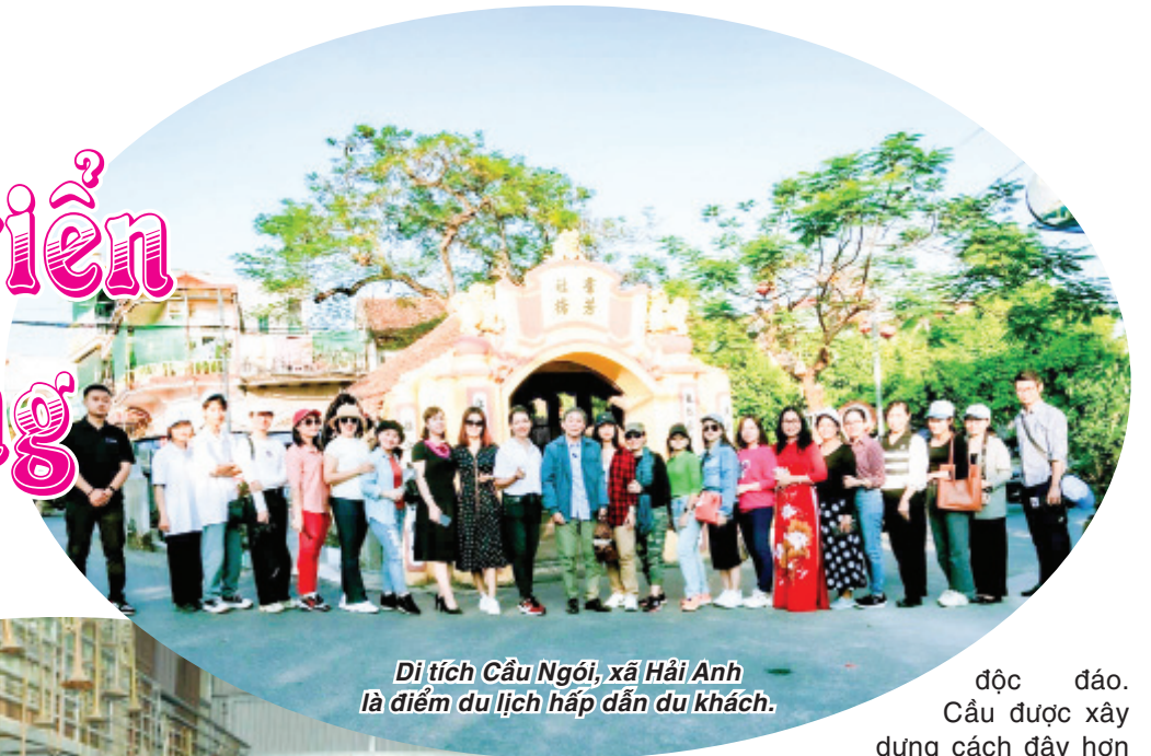
Di tích Cầu Ngói, xã Hải Anh là điểm du lịch hấp dẫn du khách.

Đến thăm làng nghề làm bánh nhân Đông Cường, khách du lịch được trải nghiệm cách làm bánh, trực tiếp tham gia vo bột, rán bánh, tẩm đường... để tạo ra đặc sản ẩm thực làm từ bột nếp, trứng gà thơm lừng hương vị quê hương đã gắn bó với người dân Hải Hậu hàng trăm năm nay. Rời thị trấn Yên Định, điểm dừng chân tiếp theo của du khách trong hành trình du lịch cộng đồng ở Hải Hậu là di tích Cầu Ngói, xã Hải Anh - một trong 3 cây cầu ngói đẹp nhất Việt Nam. Cầu nằm cách Chùa Lương chừng 100m, trên con đường dẫn vào chùa, gắn với chùa thành một cụm di tích lịch sử - văn hóa