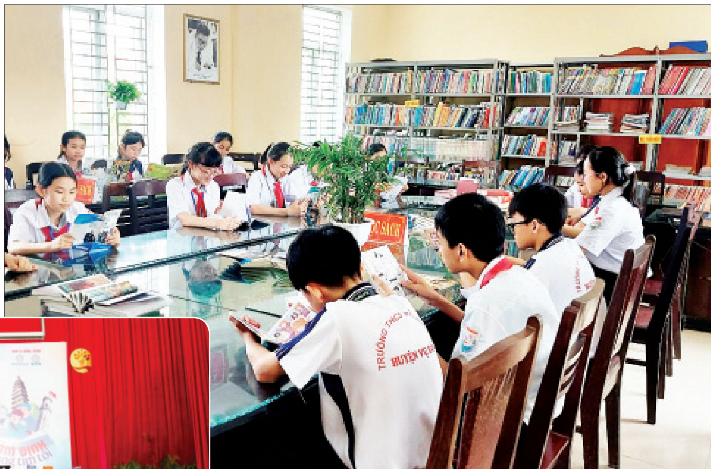
Học sinh Trường THCS Trần Huy Liệu (Vụ Bản) đọc sách trong thư viện nhà trường.

Hưởng ứng Ngày Sách và Văn hóa đọc Việt Nam tỉnh Nam Định năm 2024 (từ ngày 27-4 đến 30-4), toàn ngành Giáo dục và Đào tạo (GD và ĐT) đang tổ chức nhiều hoạt động nhằm phát huy giá trị của sách và xây dựng văn hóa đọc trong hệ thống cơ sở giáo dục (CSGD); góp phần xây dựng đời sống văn hóa tinh thần, phát huy những giá trị đạo đức, truyền thống hiếu học của quê hương, đất nước.