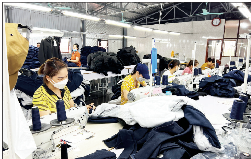
Hội viên phụ nữ huyện Hải Hậu phát triển kinh tế gia đình từ nghề may quần áo xuất khẩu.