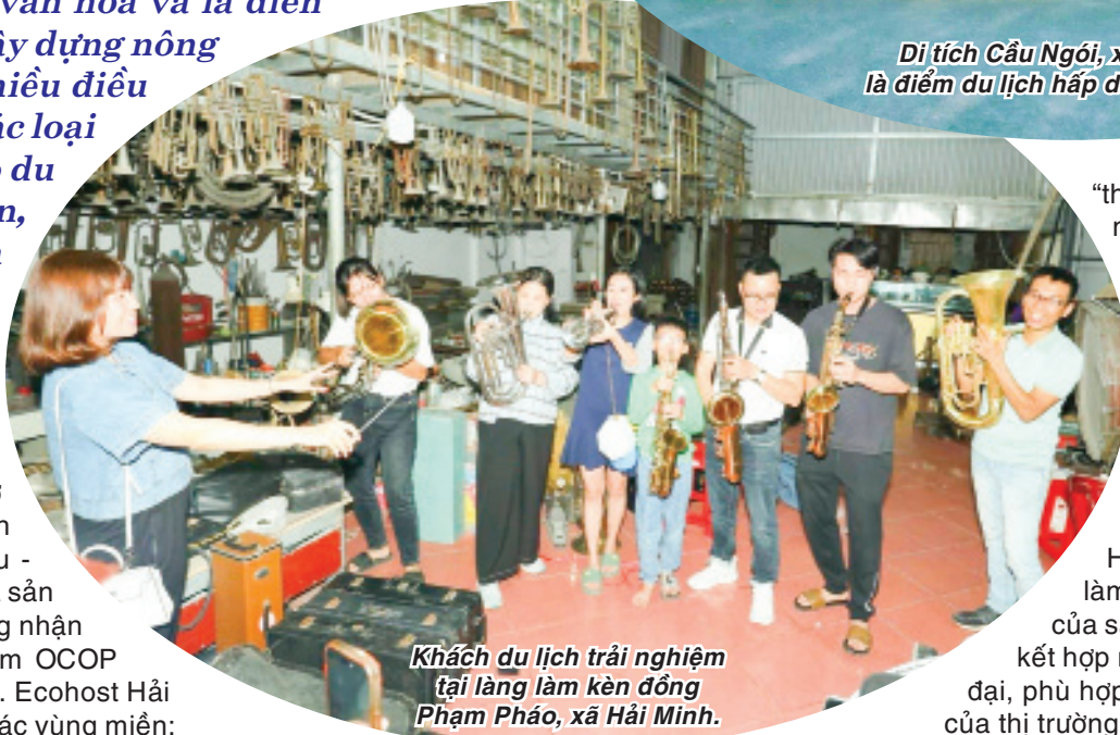
Khách du lịch trải nghiệm tại làng làm kèn đồng Phạm Pháo, xã Hải Minh.

hình du lịch Ecohost Hải Hậu còn mang đến những trải nghiệm du lịch đồng quê như: đi xe đạp khám phá, trải nghiệm không gian sống và tinh thần lao động chăm chỉ, cần mẫn của người dân địa phương... Thời điểm mới ra đời của Ecohost Hải Hậu đúng lúc đại dịch COVID-19 ập đến. Mặc dù vậy sau khi dịch lui, thị trường du lịch từng bước khôi phục thì hoạt động của mô hình đã nhanh chóng khởi sắc. Thu nhập của cộng đồng địa phương tham gia vào chuỗi dịch vụ của Ecohost Hải Hậu trung bình đạt mức 30-50 triệu đồng/hộ cho thấy sức hấp dẫn của mô hình này.