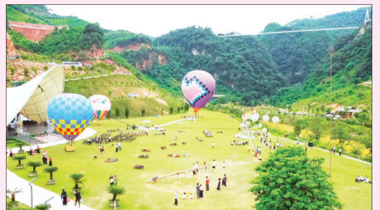
Khu du lịch Mộc Châu Island tại xã Mường Sang, huyện Mộc Châu.