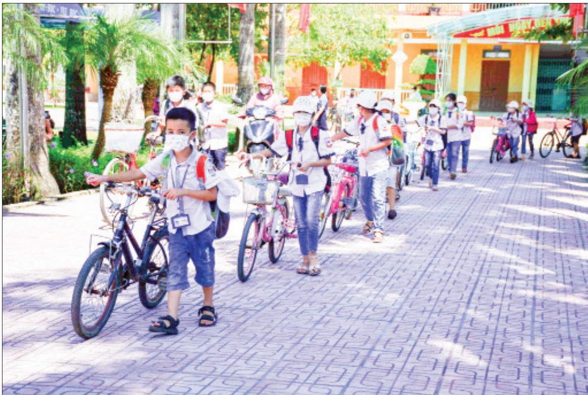
Trường Tiểu học Nam Tiến (Nam Trực) giáo dục học sinh kỹ năng tham gia giao thông an toàn khi tan học thông qua mô hình "Cổng trường an toàn giao thông".

Nhiều năm qua, các CLB: Truyền thông, (Xem tiếp trang 8)