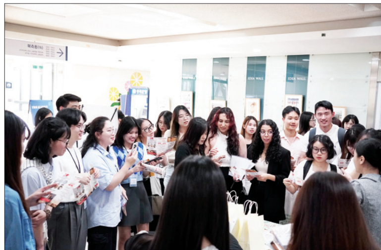
Tại phiên hội chợ hướng nghiệp, các học sinh có cơ hội tiếp xúc trực tiếp với các nhà tuyển dụng.

Dưới sự bảo trợ của Đại sứ quán Việt Nam, Hội Sinh viên Việt Nam tại ba trường đại học danh tiếng của Hàn Quốc gồm: Đại học Yonsei, Đại học quốc gia Seoul và Đại học Korea vừa phối hợp tổ chức Diễn đàn hướng nghiệp thanh niên Beyond nhằm tạo cơ hội kết nối sinh viên các trường đại học với doanh nghiệp Hàn Quốc. Đây cũng nằm trong nỗ lực của Hội Sinh viên Việt Nam nhằm thúc đẩy giao lưu giữa thanh niên hai nước Việt Nam và Hàn Quốc.