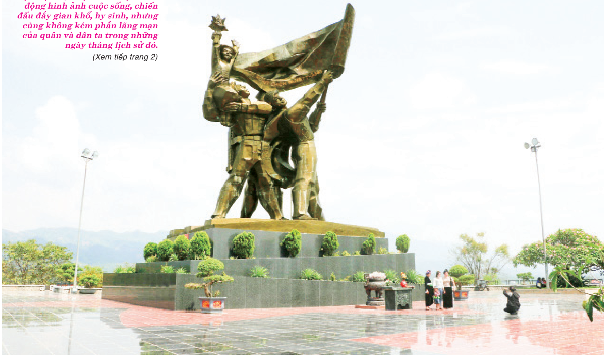
Tượng đài Chiến thắng Điện Biên Phủ - một tác phẩm điêu khắc có giá trị được đặt tại Thành phố Điện Biên Phủ.