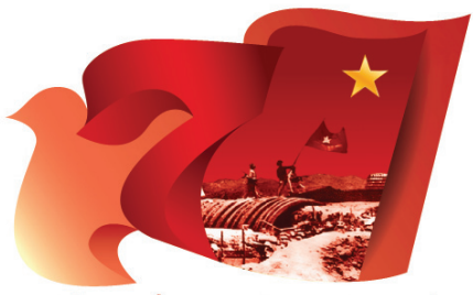
CHIẾN THẮNG ĐIỆN BIÊN PHỦ 7/5/1954 - 7/5/2024