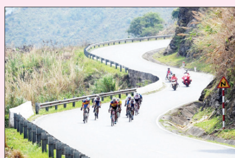
Cuộc đua xe đạp về Điện Biên Phủ mang lại nhiều thử thách cho các tay đua.

Có lẽ xuất phát từ chính mục tiêu, đặc điểm chung mà các cuộc đua về Điện Biên Phủ do Báo Quân đội nhân dân tổ chức, về mặt chuyên môn luôn mang tính cống hiến cao. Các cua-rơ luôn bước vào cuộc đấu với sự chuẩn bị kỹ lưỡng, quyết tâm cao độ, thi đấu hết mình để đạt thành tích cao nhất, cống hiến cho người xem những kỹ, chiến thuật và những cú bút phá ngoạn mục. Họ đua tranh sòng phẳng, song không hề có biểu hiện của sự cay cú, ăn thua. Thậm chí, trên những cung đường đua cam go ấy, các đội đua từ lãnh đội, huấn luyện viên đến vận động viên