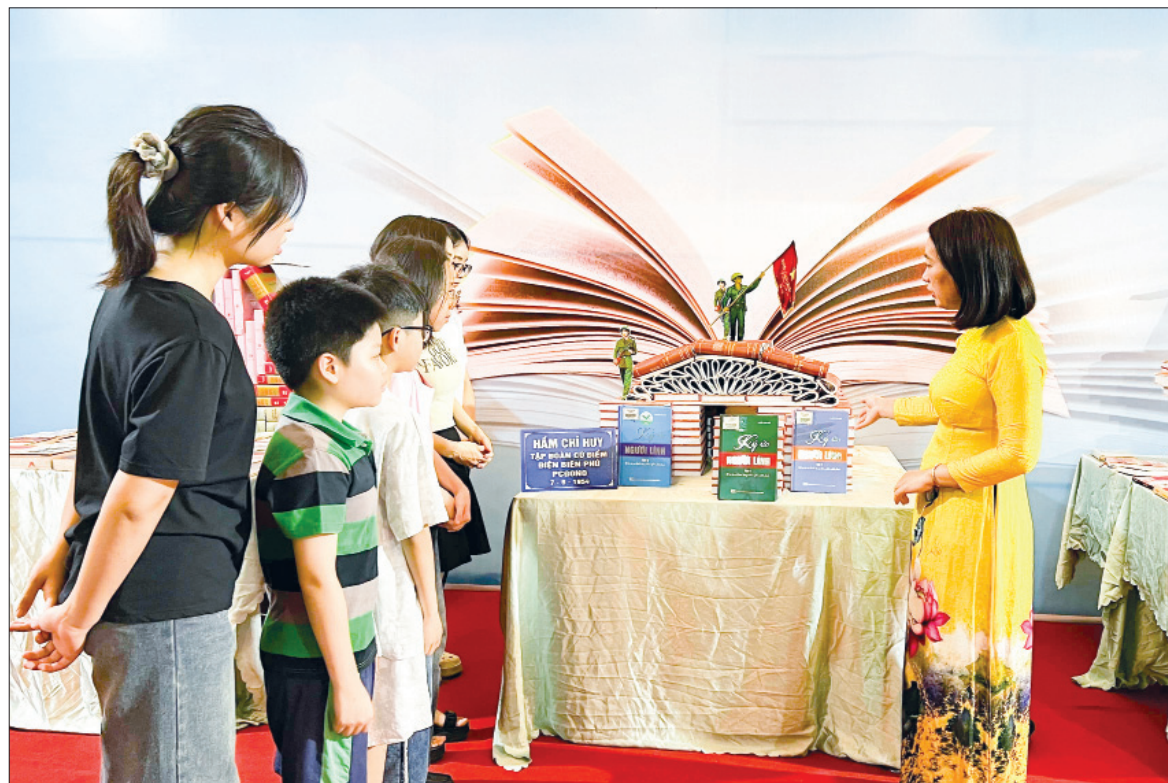
Đông đảo học sinh thích thú tham quan, tìm hiểu mô hình xếp sách nghệ thuật của Thư viện tỉnh, chủ đề kỷ niệm 70 năm Chiến thắng Điện Biên Phủ (7-5-1954 - 7-5-2024).