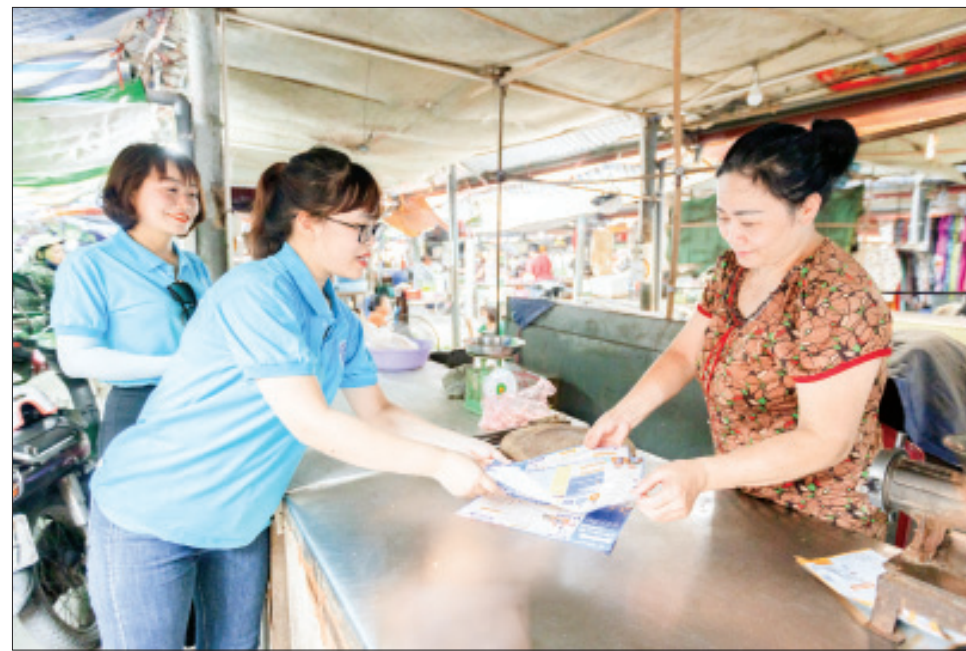
Cán bộ Bảo hiểm xã hội tỉnh tuyên truyền người dân thành phố Nam Định về chính sách bảo hiểm y tế.