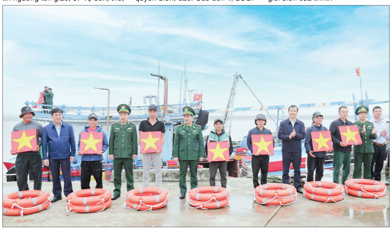
Lãnh đạo Bộ Chỉ huy Bộ đội Biên phòng tỉnh và Mặt trận Tổ quốc tỉnh trao tặng Cờ Tổ quốc và áo phao cho ngư dân vươn khơi bám biển.