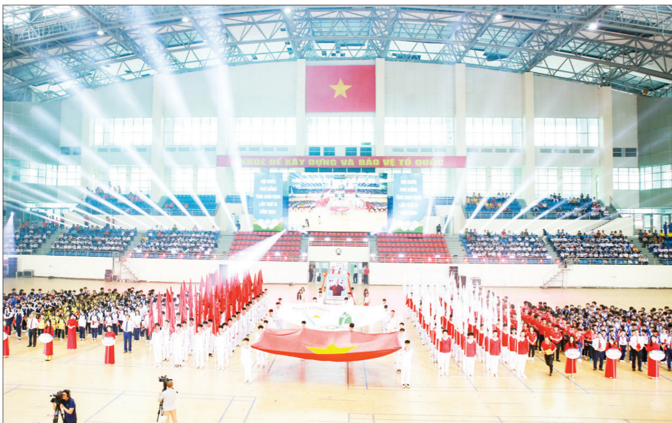
Quang cảnh Lễ khai mạc Hội khỏe Phù Đổng tỉnh lần thứ XI năm 2024.

HKPD tỉnh lần thứ XI năm 2024 diễn ra từ ngày 24-4 đến ngày 7-5, có sự tham gia của 65 đoàn thể thao với hơn 3.000 VĐV thuộc 10 Phòng Giáo dục và Đào tạo các huyện, thành phố Nam Định, các trường THPT, các trung tâm giáo dục thường xuyên. Các VĐV thi đấu tranh tài 10 môn (Bóng đá, Bóng bàn, Điền kinh, Vovinam, Kéo co, Đá cầu, Cầu lông, Võ cổ truyền, Cờ vua, Aerobic) với 68 bộ huy chương (68 HCV, 120 HCB, 136 HCD). Địa điểm thi đấu các môn tại: Sân vận động Thiên Trường, Sân bóng đá Trung tâm Thể thao thành tích cao tỉnh, Nhà thi đấu Trần Quốc Toàn, Trường Tiểu học Trần Nhân Tông, Trường Cao đẳng Sư phạm Nam Định, Cung Thể thao tỉnh./