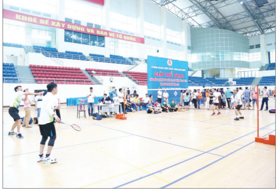
Công đoàn Viên chức tỉnh tổ chức giải thể thao cho công chức, viên chức, lao động.

Hội Cựu chiến binh (CCB) huyện Vụ Bản có 7.900 hội viên, sinh hoạt tại 22 chi hội. Những năm qua, Hội CCB huyện đã đẩy mạnh thực hiện các phong trào thi đua, trong đó nổi bật là phong trào "CCB giúp nhau giảm nghèo, làm kinh tế giỏi" góp phần hỗ trợ, giúp đỡ hội viên phát triển kinh tế, xây dựng cuộc sống ấm no, bền vững. Đề phong trào "CCB giúp nhau giảm nghèo, làm kinh tế giỏi" lan tỏa sâu rộng, các cấp hội đã gắn phong trào thi đua với thực hiện cuộc vận động "Học tập và làm theo tư tưởng, đạo đức, phong cách Hồ Chí Minh". Các cấp Hội CCB trong huyện đã tập trung đẩy mạnh công tác tuyên truyền, vận động hội viên thay đổi cách nghĩ, cách làm, mạnh dạn đầu tư phát triển kinh tế, chuyển đổi cơ cấu cây trồng, vật nuôi, áp dụng khoa học, kỹ thuật vào sản xuất... Đồng thời phối hợp tổ chức các lớp tập huấn nghiệp vụ trồng trọt, chăn nuôi và phát triển kinh tế trang trại cho hội viên; tổ chức cho