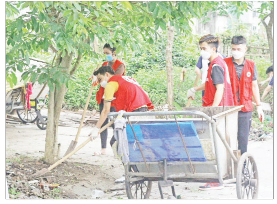
Đội tình nguyện viên Chữ thập đỏ tỉnh tham gia dọn vệ sinh môi trường tại phường Hạ Long (thành phố Nam Định).

Tại hội trường Trường Đại học Kinh tế - Kỹ thuật Công nghiệp Nam Định một ngày cuối tháng 4 oi bức, một nhóm các tình nguyện viên thuộc Đội tình nguyện viên CTĐ tỉnh người út đảm mồi hỏi vấn đang miệt mài làm công tác "hậu cần" phục vụ chương trình hiến máu nhân đạo thường niên do Hội CTĐ tỉnh tổ chức. Ngay từ sáng sớm khi chương trình chưa bắt đầu, các tình nguyện viên đã có mặt đông đủ để sắp xếp hội trường, chuẩn bị chỗ ngồi, chỗ nghỉ cho người đến đăng ký hiến máu. Trong chương trình, họ giúp ban tổ chức hướng dẫn người hiến máu điền các thông tin cần